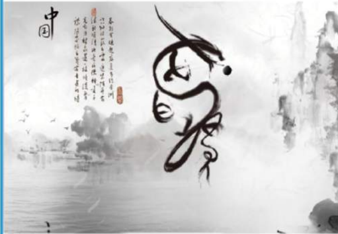
《龙的传人》 设计说明

根据“两岸大学生汉字文化创意大赛”的主题，联系两岸，两岸人民同根同源，同是龙的传人，便以“龙的传人”四个汉字为基本元素，组成中国龙的样式。龙本就是中国的吉祥物，再运用水墨画的笔触展现出来，更富中国风。